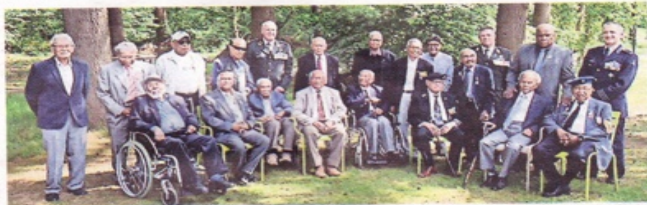
Behalve Molukse oud-militairen waren ook familieleden van inmiddels overleden KNIL'ers aanwezig bij de bijeenkomst bij het Veteraneninstituut.