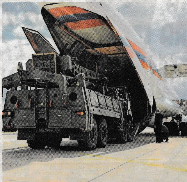
Het Russische S-400 raket-systeem wordt in Turkije uitgeladen.

Het meldpunt is bereikbaar van ma t/m vr tussen 9.00 en 17.00 uur. Telefoon 06 58076647 en via e-mail: Defensiemeldpuntburnpits@caop.nl . Daarnaast is er informatie beschikbaar via www.defensiemeldpuntburnpits.nl