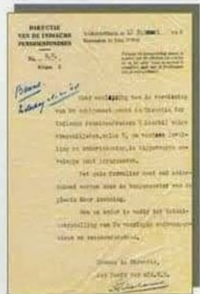
'Bericht van Indisch pensioenfonds'