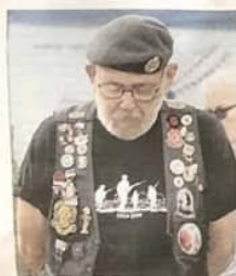
A veteran from the local short group