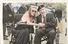
Supporters of Preston's Armed Forces Day 2018