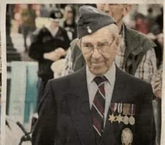
A young veteran stands in the Mayor of Preston photo's speech