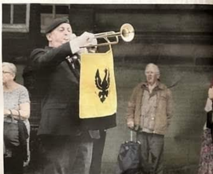
Military veterans at Preston's Armed Forces Day 2018

A Preston International Music Centre with a 'Preston' banner was one of the highlights of the day. A large number of military bands and the city's uniformed organisations, including the Royal Preston Rifles and the Royal Preston Rifles, were in the city to mark the day. The day was a very special one for the city, and it was a pleasure to have so many people in the city to mark the day. There's a long and proud history of the city's military and it was a pleasure to have so many people in the city to mark the day.