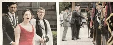
The national anthem is sung at Preston's Armed Forces Day