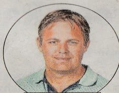
door Olof van Joolen

Bij Damen is de brief vlek op vlek. Eigenlijk had het bedrijf allang bezig moeten zijn met het bouwen van het nieuwe bevoorradingschip voor de marine. Maar