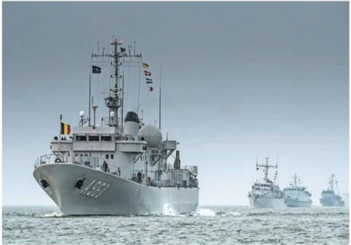
Vlootverband SNMCMG1 arriveert vrijdagochtend in Den Helder voor een havenbezoek.

We moeten de explosieven eerst identificeren, dan een kabel eronderdoor graven, die om de bom vastmaken. Daarna gaat hij aan een ballon die we vullen met lucht, waardoor hij van de grond afkomt, waarna we hem neutraliseren. Dat doen we door een andere lading op de lading te plaatsen, en die tot ontploffing te brengen.” Er is ook een kanon gevonden. „Dat was een verrassing, maar het kanon hebben we helaas niet boven water kunnen