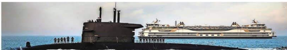
Een onderzeeboot uit de Walrusklasse kruist de veerboot tussen Den Helder en Texel.