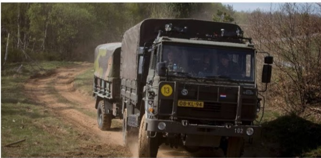
Een DAF YA 4442 in dienst van het Nederlandse leger

Het Belgische leger koopt 900 vrachtwagens bij de Nederlandse vrachtwagenfabrikant DAF. Dat heeft de VRT-redactie vernomen uit een bron dicht bij het dossier. De aankoop is goed voor 260 miljoen euro.