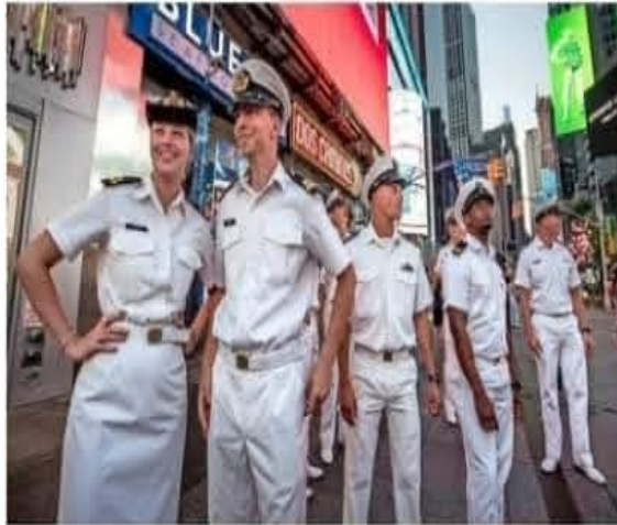
Nederlandse marinemen in tropenwit in New York.