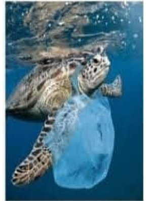
Een schildpad met troep uit de plasticsoep.

De gemeente Leiden is een van de andere genomineerden. Leiden heeft volgens de jury alles uit de kast