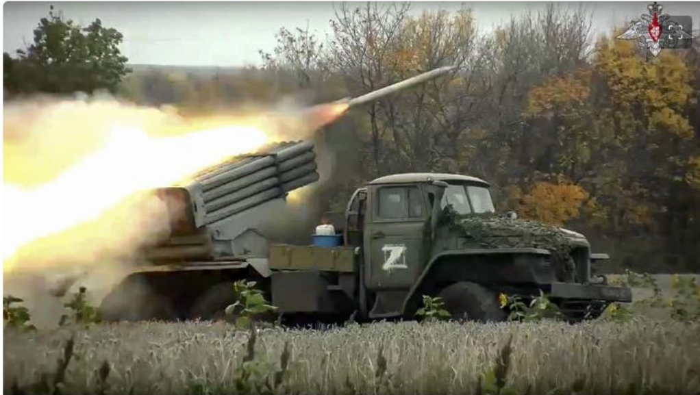
Geven de Russen de strijd om de stad Cherson op of is het een val voor de Oekraïners?