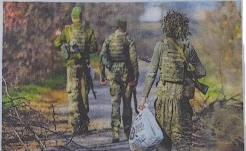
Oekraïense soldaten in een buitenwijk van Cherson.

Op donderdag plaatsten Russische oorlogsbloggers