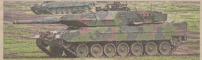
De Duitse Leopard-tank.