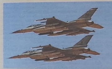
F-16's kunnen veel meer dan de MIG-29's waarover de Oekraïense luchtmacht nu beschikt.

Eén F-16 kan - dankzij uitstekende radar en air-to-airraketten met een veel grotere reikwijdte - een aantal Russische toestellen tegelijkertijd dwingen om veel verder van de frontlinie te blijven. Daarnaast is de F-16 dankzij diezelfde radar en raketten veel beter in het opspreken en neerhalen van kruisraketten en drones. Dat neerhalen wordt nu nog gedaan vanaf de grond met ouderwetse zware mitrailleurs.