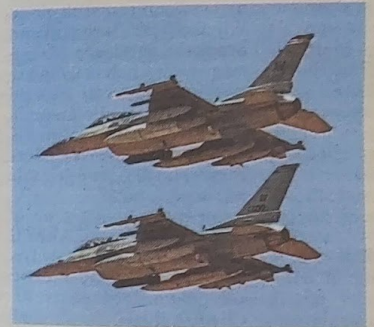
F-16's kunnen veel meer dan de MIG-29's waarvoor de Oekraïense luchtmacht nu beschikt.

Eén F-16 kan - dankzij uitmuntende radar en air-to-airraketten met een veel grotere reikwijdte - een aantal Russische toestellen tegelijkertijd dwingen om veel verder van de frontlinie te blijven. Daarnaast is de F-16 dankzij diezelfde radar en raketten veel beter in het opsporen en neerhalen van kruisraketten en drones. Dat neerhalen wordt nu nog gedaan vanaf de grond met onderwets zware mitrailleurs.