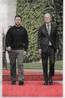
Olaf Scholz rolde de rode loper uit voor president Zelenski.

Het is onduidelijk waarom het ministerie naar buiten treedt met informatie over de vermeende dood van de twee commandanten.