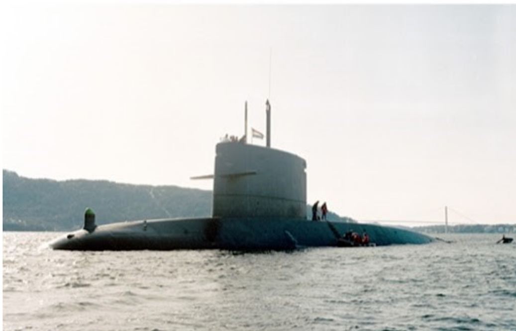
Zr.Ms. Walrus in 1992. Meer over de Walrusklasse.

Op donderdag 12 oktober wordt Zr.Ms. Walrus uit dienst gesteld. De Walrus, naamgever van de vier huidige Nederlandse onderzeeboten, wordt als eerste uit dienst gesteld in aanloop naar de vervanging van de Walrusklasse. Die vervanging laat weliswaar nog zo'n tien jaar op zich wachten, maar om de onderzeeboten in de vaart te kunnen houden stelt de Onderzeedienst twee van de vier boten uit dienst.