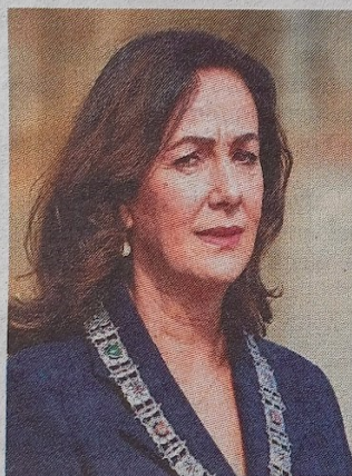
Femke Halsema

Veteranen zijn in hun wiek geschoten. „Veel andere vetera-