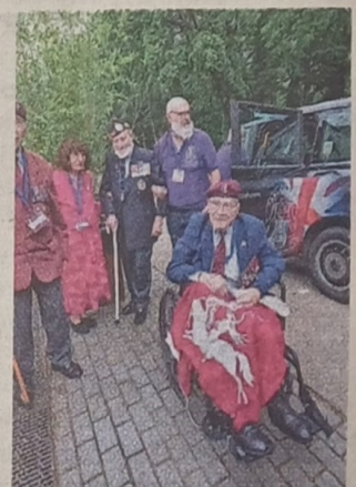
Veteranen van WO II komen weer naar Nederland.

Het zestal krijgt vandaag een 'special guest'-behandeling bij de Airborne wandeltocht in Oosterbeek.