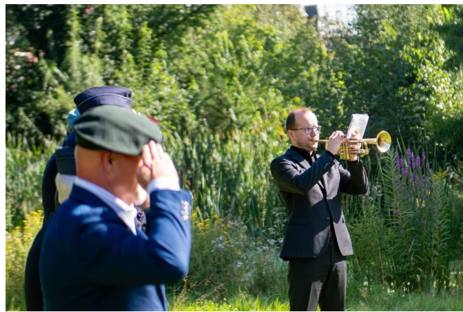
Indië—NNG herdenking 14 augustus