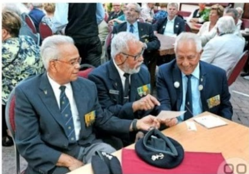
Veteranendag Hotel Den Helder

„In een vroeg stadium wordt aandacht gevraagd voor deze dag mid-